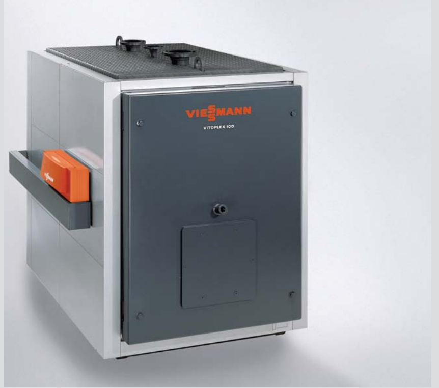
Vitoplex 100 780 - 2 000 kW