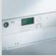
Dijital Vitotronic kontrol paneli