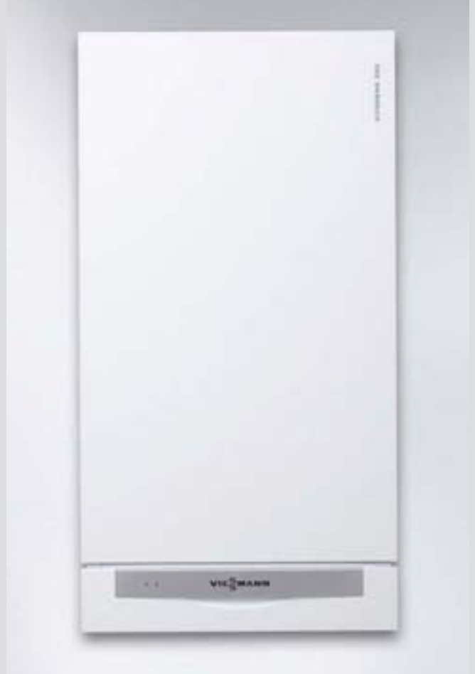
Vitodens 200-W Gaz yakıtlı kondensasyon kazanı