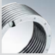
Inox-Radial ısıtma yüzeyi